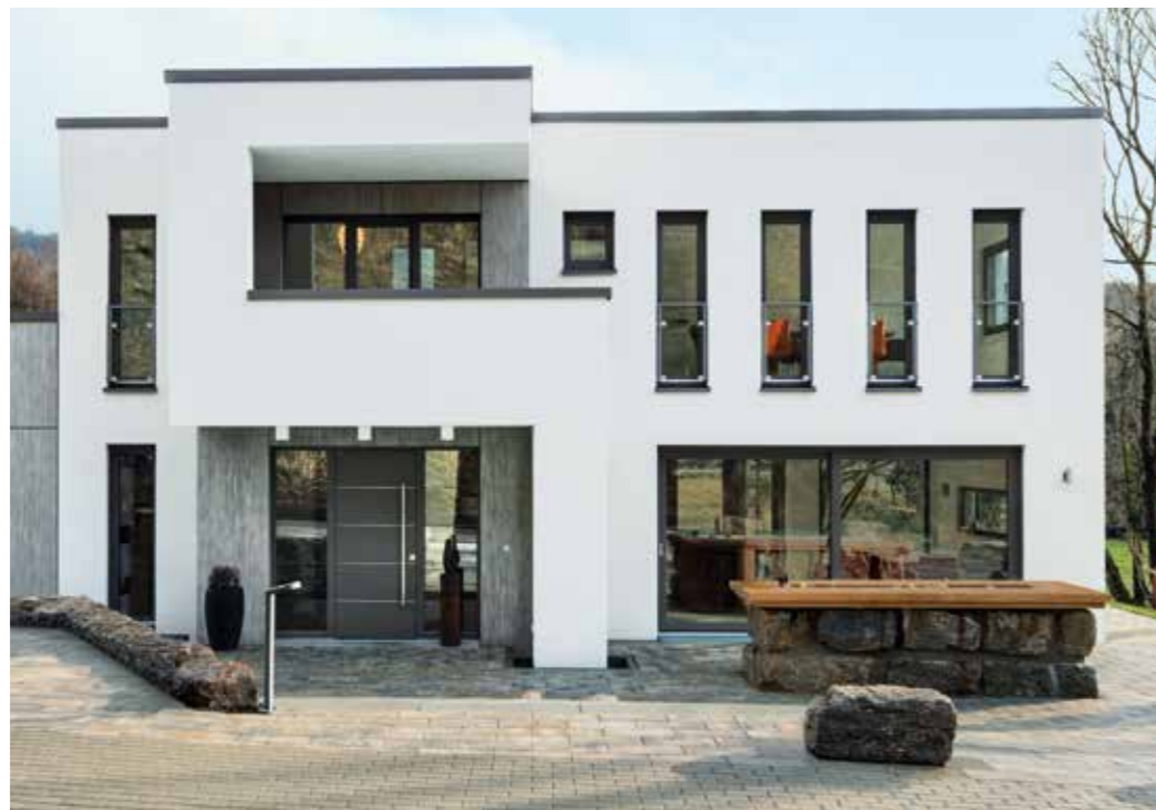
Schüco LivIng bildet die perfekte Grundlage für moderne, zeitgemäße Haustüren.

Eine Haustür ist die Visitenkarte eines Hauses und verleiht dem Eingangsbereich Charme und Ästhetik. Aber nicht nur optisch muss eine Haustür überzeugen. Funktionalität und Langlebigkeit stehen dabei ebenso im Mittelpunkt. Mit Schüco LivIng können Sie Ihre persönlichen Ansprüche in einer Tür vereinen. Gestalten Sie Ihre neue Kunststoff-Haustür ganz nach Ihren Vorstellungen und Wünschen. Gleichzeitig bietet Schüco LivIng eine innovative Technologie, die beste Wärmedämmung bis auf Passivhausniveau und erhöhten Einbruchschutz bis zur Widerstandsklasse 2 (RC2) ermöglicht.